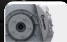
Brembo - gray