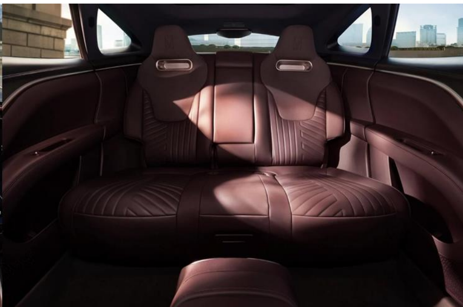
Красная бургундия/Burgundi red